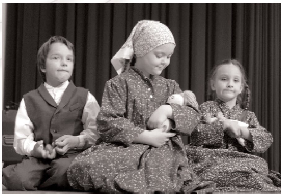
Otroška plesna skupina Krog iz Maribora pri uspavanju punčk iz cunji. (Maribor, medobmočno srečanje otroških folklornih skupin. (Foto: Janez Eržen, maj 2006.)

Ko so bili otroci dovolj stari, so šli spat sami, in sicer takrat, ko je eden izmed staršev tako ukazal. Spat so jih pošiljali, ko je bilo še svetlo, pozimi pa ob petrolejki, saj elektrike ni bilo. Pogojev za prebiranje pravljic ali petje uspavank dejansko ni bilo. Starši so bili utrujeni od celodnevne dela in niso imeli moči, da bi se še ukvarjali z otroki. Prav tako ni bilo elektrike - le kako boš bral ali pel