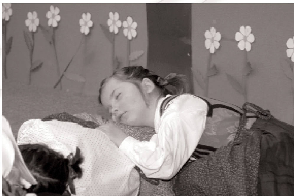
Otroška folklorna skupina Mlinček iz Brezj ob odrskem prikazovanju uspavanke. Medobmočno srečanje otroških folklornih skupin v Radovljici.