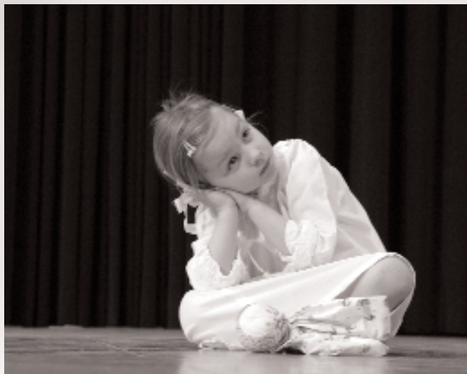
Otroška folklorna skupina vrtca Vrtiljak iz Maribora. Medobmočno srečanje otroških folklornih skupin v Mariboru. (maj 2006.)

v temi? Pa tudi knjig je primanjkovalo. V celi vasi ni bilo niti ene. Informatorica je dobila prvo (in edino), šele ko je šla v šolo - šlo je za neko italijansko čitanko.