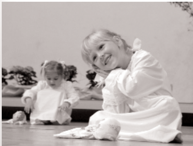
Otroška folklorna skupina vrtca Vrtiljak iz Maribora. Medobmočno srečanje otroških folklornih skupin v Mariboru. (Foto: Janez Eržen, maj 2006.)

Kakšen je bil torej obred spanja? Pred spanjem so si umili roke in noge v lavorju. Kopali so se le enkrat na teden v škafu. Vodo so morali nositi iz studenca, saj vodovod še ni bil napeljan. Postelje so bile lesene in ozke. Na eni sta spala po dva otroka, starši so imeli malce širšo posteljo. Namesto vzmetnic so uporabljali kožuhinke iz koruznega ličja, ki se je menjalo vsako leto. Pokriti so bili z volnenimi odejami. Spali so v spodnjih hlačkah in majčkah z dolgimi rokavi. Vsa oblačila, ki so jih nosili, so bila narejena doma, le blago je bilo kupljeno.